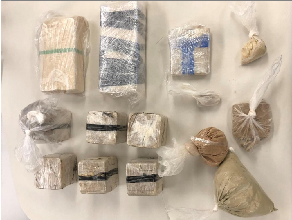
Ein Teil des sichergestellten Heroins und Streckmittels.