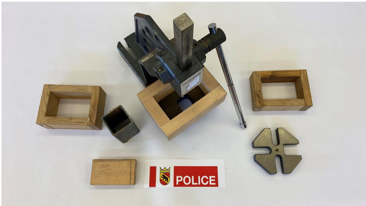
Eine sichergestellte Heroinpresse.