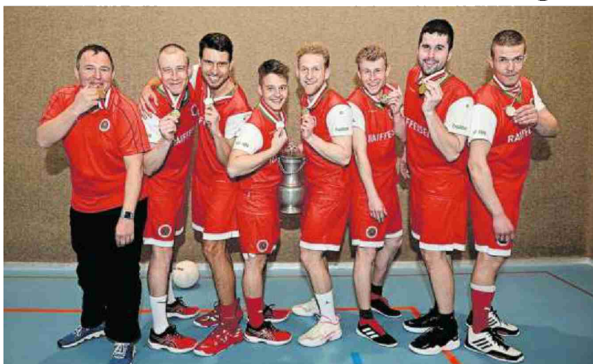
Gewinnen den Korbball-Cup 2021/2022: Das Siegerteam des TV Grindel.